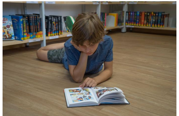
Am Tag der offenen Tür - so viel Spaß kann Lesen bereiten.