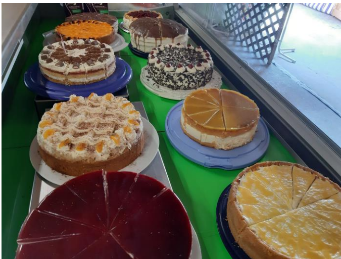
Eine große Auswahl an Torten wurde von den Mitbürgern aus der Gemeinde Lengdorf gespendet.

Die Gäste ließen sich bei schönem Wetter und zünftiger Musik vom Alleinunterhalter Bernie, ihr Hendl oder die Schweinswürstl zum Bier schmecken.