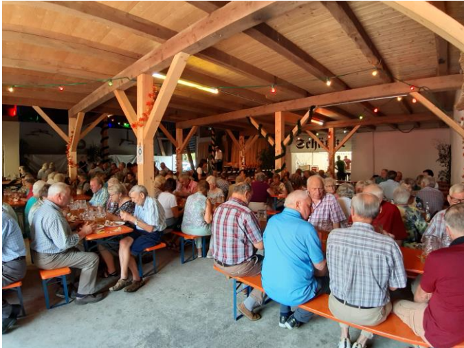
Seniorenachmittag in Lengdorf

Im Rahmen des Hoffestes beim Gasthaus Menzinger richtete heuer wieder der Landkreis den Lengdorfer Seniorenachmittag aus. Es wurden insgesamt 450 Seniorinnen und Senioren ab 65 Jahre eingeladen und der Einladung sind 270 gefolgt. Gastgeber Landrat Martin Bayerstorfer freute sich auch heuer wieder besonders auf den Lengdorfer Seniorenachmittag und begrüßte alle anwesenden Gäste mit einer kleinen Ansprache.